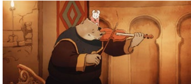
ERNEST & CÉLESTINE: LE VOYAGE EN CHARABIE