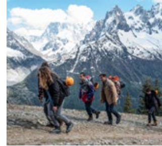
LES TÊTES GIVRÉES