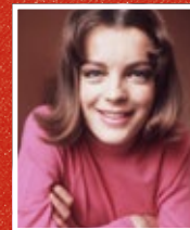
Romy Schneider (1938 – 1982)