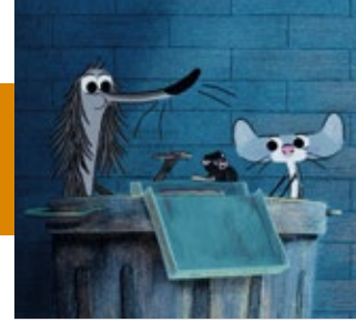
CHIEN POURRI, LA VIE À PARIS !